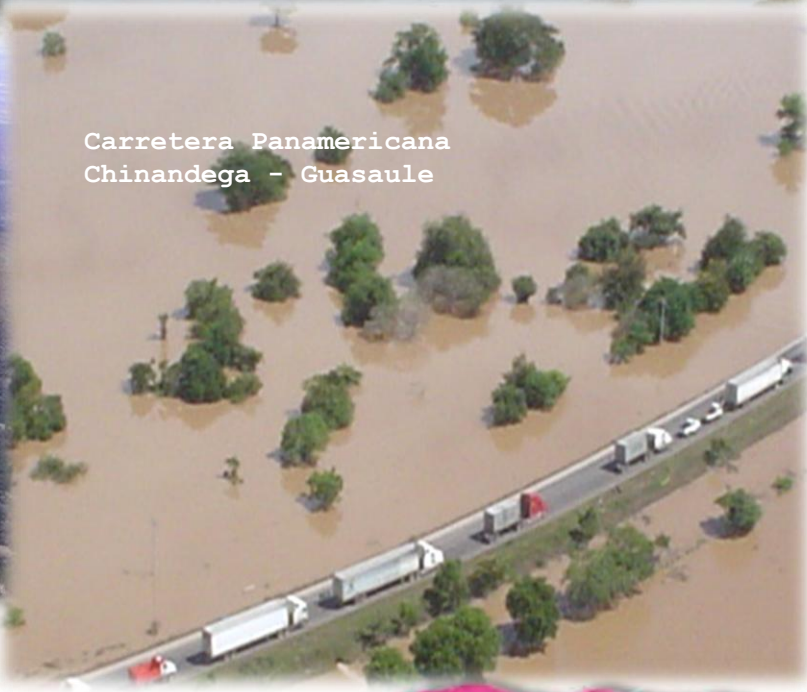
Carretera Panamericana Chinandega - Guasaule