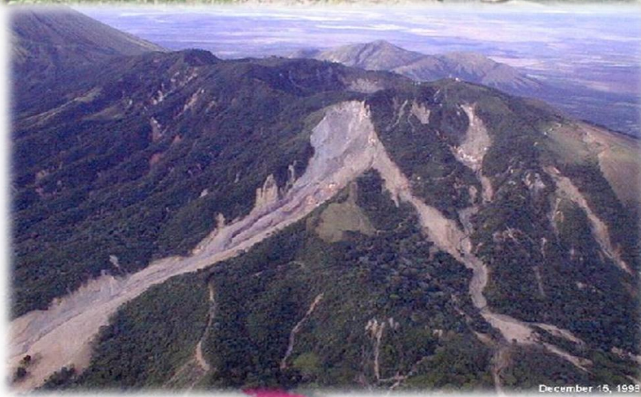
December 15, 1993